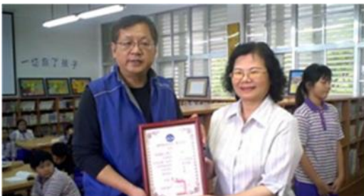
愛心圖書室-台東美和國小