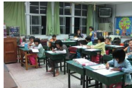
花蓮夜輔班的小朋友

馬會長並與各國小校長及小朋友合影留念。這是我們第一次大規模的參與台灣項目。馬會長說看到那些山區貧困的孩子們在新建的圖書室裡看書，繪畫及做一些其他課餘活動，心裡有說不出的高興。學校的老師們更是高興有一個設備完善的圖書室讓孩子們下課後有個好地方活動。