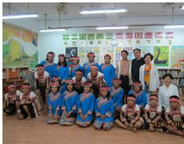
專協愛心圖書室-台東武陵國小