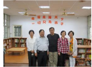
春風愛心圖書室-台東鹿野國小