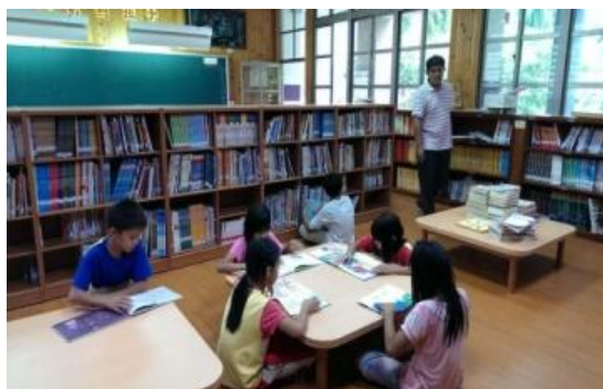
地板換成耐磨地板、新書架、閱讀桌及層板

圖書室曾在已退修的柯校長任職時整修過，四周的牆面都已貼上木板，地板也貼上木質地板，惜因使用多年，早以斑駁老舊，有些地方還有腐蝕現象，地面顯得很不乾淨。至於書架，有一面牆的書架過高，學生拿書找書都不方便，也不安全，旁邊擺了凳子和早期水泥工用的木梯，十足破壞室內閱讀氛圍。另 3 面牆雖有書架，有些層板卻早已不見，油漆也已褪色，尤其放在圖書室中間的書架除了也有層板遺失和油漆剝落的問題外，還有早期做的書架既笨重又太深，學生找書不易，大大削弱學童入內閱讀的意願。