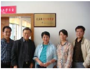
復笠圍圖書室 (中-章瑛理事)

此次湖北行使我深深感受到武漢湖北省博物館“曾侯乙墓”之壯觀，讚嘆二千四百年前編鐘之神奇，其中之奧妙複雜只有學物理和喜歡音樂的人才可能了解。在舊金山亞洲博物館當導覽的我，實在很慶幸因要去荊州鄉村考察愛心小學，提早到達武漢而在第一時間先睹為快地去了一個下午。館藏古物之多，短時間內不可能看完，武漢真是一大文化古城。