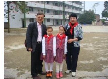
更新小學兩位可愛的留守兒童