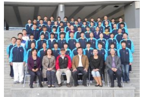
任老師和北川中學珍珠班師生合影

這些孩子是否徹底從心理上走出了災難留下的陰影，面對漫長而痛楚的復建過程，能否重新樹立起樂觀面對生活的信心，老實說我不知道。但從躺在病床上，到坐輪椅、用拐杖，丟掉拐杖自己走路也沒聽說有人自殺，她們確實站了起來。這是所有關心她們的人最想看到的結果。