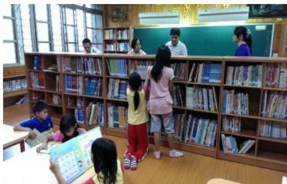
家長會長(左)專程到學校要我們向您們轉達深深的感謝

由於本會在立山國小辦理夜間課輔多年，推動閱讀是課輔活動中的主要項目之一，學校亟需為學生做個乾淨適宜的閱讀空間，以利推動閱讀，為此我們藉用『育洵大愛留人間』的經費，將圖書室加以整修，使之成為學生喜愛的閱讀空間，培養學生閱讀習慣。