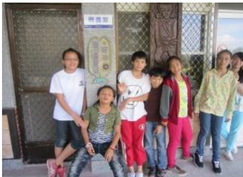
學生開心的在「育洵愛心圖書室」掛牌前合照

舞鶴國小位於花蓮縣瑞穗鄉舞鶴村64號，距北迴歸線紀念碑不遠，地理位置正好在舞鶴台地，視野遼闊，空氣超好，四周有茶園，其自然純樸的田園風光，美景難得一見。