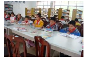
多漂亮的新圖書室啊！

圖書室之捐增人更為我們的好友。湖北農村二，三小時車程之外，實為貧困，學校孩子百分之六十以上均為留守兒童，在圖書室中看到孩子們，開心地閱讀愛基會為復笠圍圖書室準備的三千本書及貼在牆上之借書手則，使我深深感到自己和湖北是相繫的。