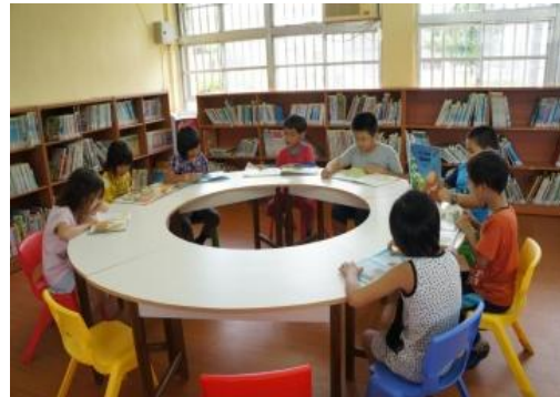
找到書後就找個位置坐下來享受書中的故事