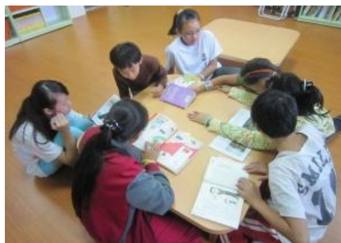
學生結伴在整修過的圖書室閱讀

書架也是年代已久，老舊沉重，部份有傾斜及層板壞損現象，不符使用，且圖書室裡沒有屬於學童適用的閱讀桌。現任校長擅長推動閱讀，於去年到任，深知閱讀力即是學生未來的競爭力，亟盼改善閱讀環境及設備，方便老師導讀及學生借書，提升學童閱讀興趣與效率，在教育處缺乏經費的情況下，轉向本會求助。