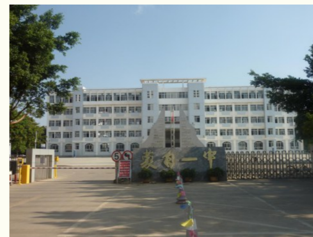
云南蒙自一中考察

捡回珍珠计划高中段：经历3月申请、4月预访审核后，本会今年将与120所全国重点高中合作办理130个高一珍珠班（其中首次合作新校为11所），9月开学后预计将有6396名穷苦而优秀的珍珠生获得救助。