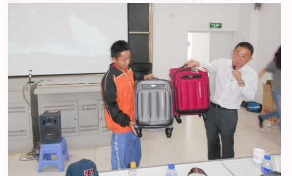
向珍珠生赠送专门订制的行李箱

在哈佛大学读书的AMP21班校友的女儿还为珍珠班的珍珠生们准备了一场精彩的英语口语兴趣交流，以《罗密欧与朱丽叶》为蓝本，让不敢开口说英语的珍珠们敢于站起来用英语和大家交流，活动最后中欧校友还贴心地为珍珠生赠送了专门订制的行李箱，希望这份关怀能伴随珍珠生的成长之路。