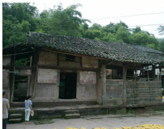
家徒四壁，唯有奖状