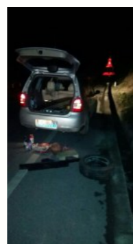
车行到半路已抛锚