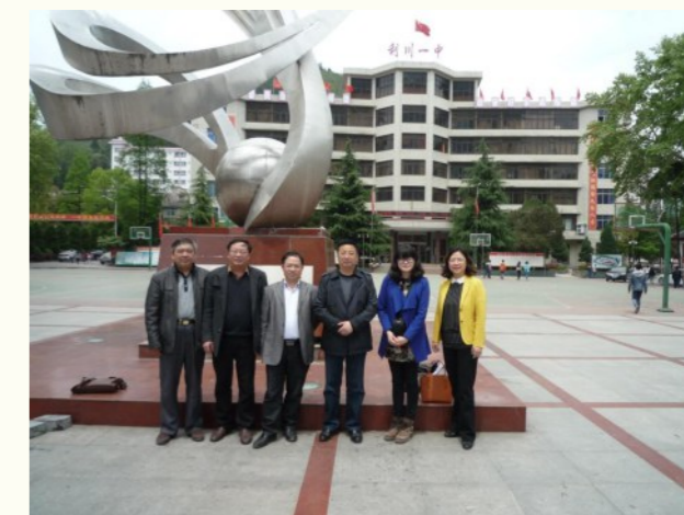
湖北利川一中考察