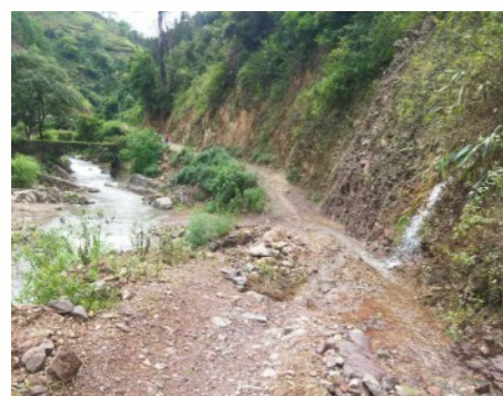
车行到半路发现已无路可走