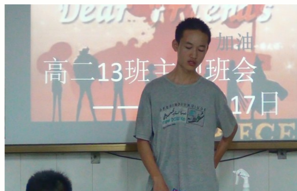
南雁参加班会谈感想