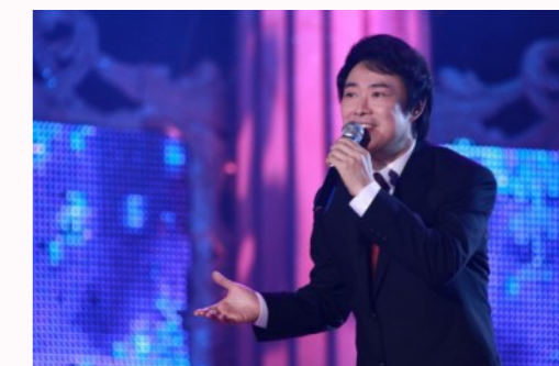
费玉清，中国台湾男歌手、主持人。本名张彦亭，1955年7月17日出生于台湾台北，祖籍安徽桐城。

1973年参加中视举办的《星对星》歌唱比赛开启歌唱事业。1984年以一首《梦驼铃》获台湾金钟奖最佳男歌星奖。1986年演唱在中国大陆播出的电视剧《一剪梅》同名主题曲大受欢迎。1992年凭借歌曲《相思比梦长》获台湾金鼎奖最佳男演唱人奖。1996年凭借《晚安曲》专辑获台湾第七届金曲奖最佳演唱专辑奖。2006年受邀与周杰伦合唱歌曲《千里之外》。1995年、1997年获得金钟奖最佳综艺节目主持人奖。2005年其主持的《费玉清的清音乐》栏目获得金钟奖歌唱音乐节目奖并凭其栏目个人获得歌唱音乐主持人奖。2009年于超级盛典荣获终身成就奖。