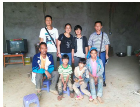
泥泞的小路上驱车颠簸5个多小时，再步行山路，终于找到一颗珍珠