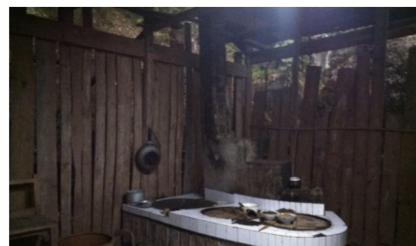
简陋且漏雨的厨房